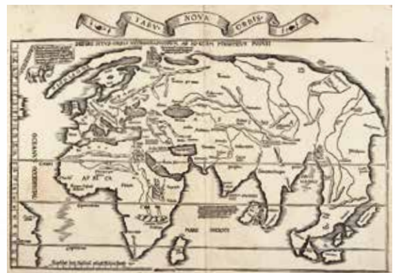
Weltkarte des Laurent Fries 1522 , basierend auf Originalkarte des Martin Waldseemüller von 1513