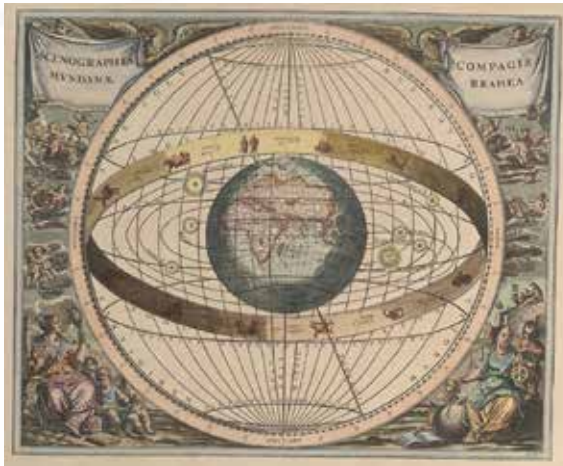
Geozentrisches Weltbild von Claudius Ptolemäus aus dem Band Harmonia Macrocosmica , 1660/61 von Andreas Cellarius