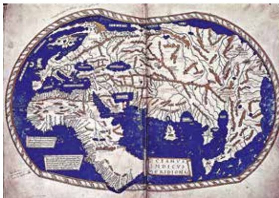
Reproduktion der Weltkarte um 1489 von Heinrich Hammer