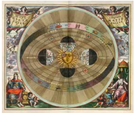
Heliozentrisches Weltbild von Nikolaus Kopernikus aus dem Band Harmonia Macrocosmica , 1660/61 von Andreas Cellarius